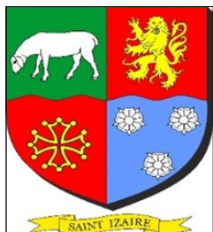
Saint-Izaire, bâti sur la pierre !